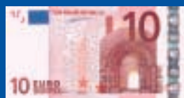
10 euros : 127 x 67 mm, rouge