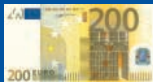
200 euros : 153 x 82 mm, jaune