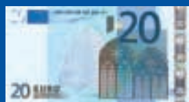
20 euros : 133 x 72 mm, bleu