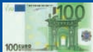
100 euros : 147 x 82 mm, vert