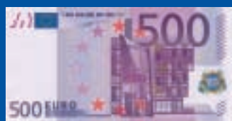
500 euros : 160 x 82 mm, violet