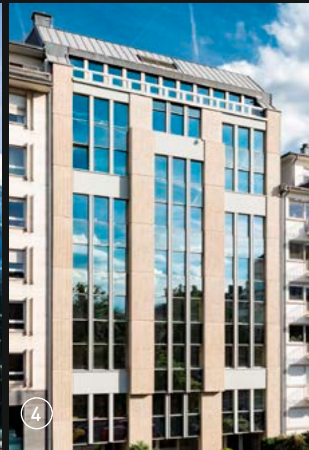
Foto 1: Sitz der BCL Foto 2: Das Pierre Werner Gebäude Foto 3: Das Monterey Gebäude Foto 4: Gebäude Boulevard Royal 7