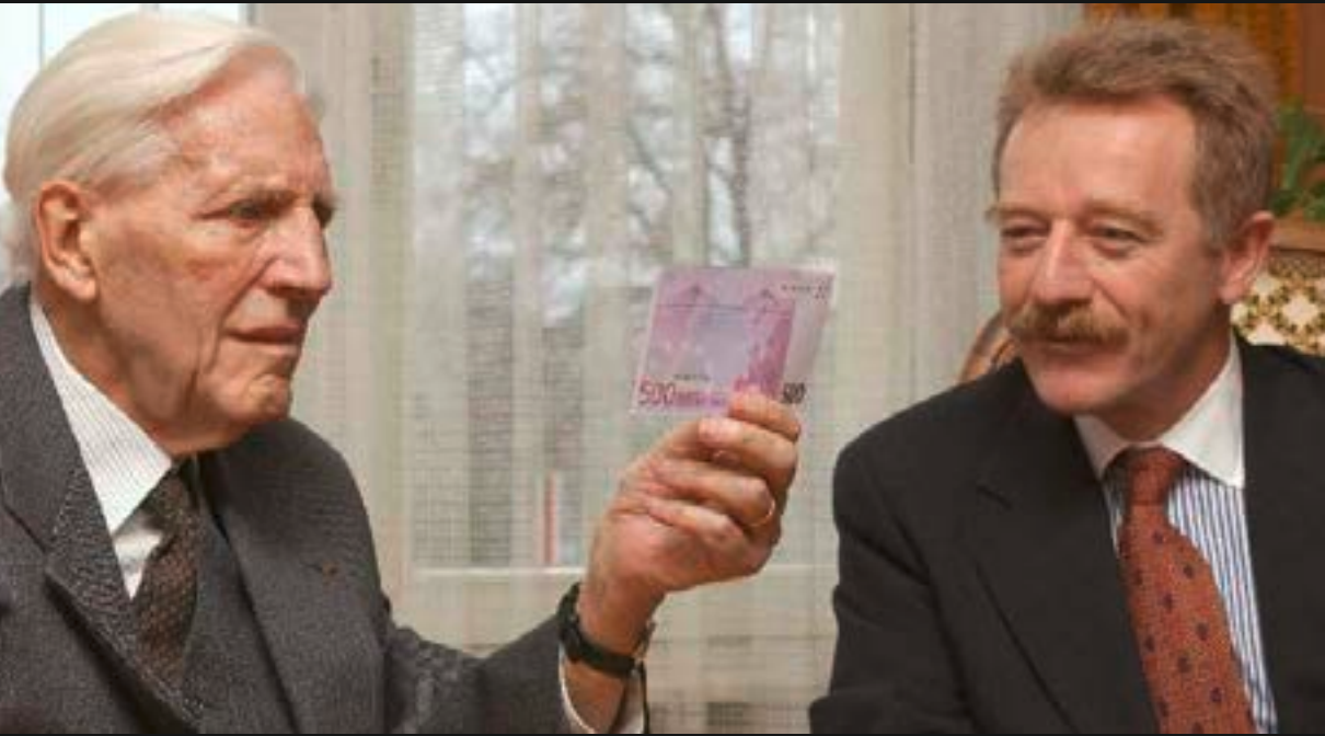
Foto: 4. Dezember 2001: Der erste Präsident der BCL, Yves Mersch, übergibt Pierre Werner eine erste Euro Banknote.

Elf EU Mitgliedstaaten wurden beim europäischen Gipfeltreffen am 2. Mai 1998 bestimmt, um dem Euroraum beizutreten: Belgien, Deutschland, Irland, Spanien, Finnland, Frankreich, Italien, Luxemburg, die Niederlande, Österreich und Portugal. Am 1. Januar 1999 führten diese Staaten den Euro als Buchgeld ein und zeitgleich erhielt der Euroraum eine einheitliche Geldpolitik. Die ersten Euro-Scheine und -Münzen wurden am 1. Januar 2002 eingeführt. Seit 1999 sind mehrere Mitgliedstaaten der Europäischen Union dem Euroraum beigetreten: Griechenland (2001), Slowenien (2007), Zypern und Malta (2008), die Slowakei (2009), Estland (2011), Lettland (2014) und Litauen (2015).