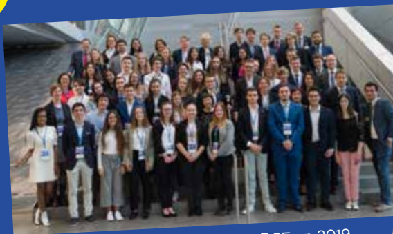
Les lauréats européens à la BCE en 2019.

Les membres de l'équipe gagnante seront invités à la cérémonie officielle de remise des prix à la Banque centrale européenne , à Francfort, si la situation sanitaire le permet, aux côtés des lauréats des autres concours nationaux.